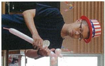
クラウン白玉(職員) ブルーシート