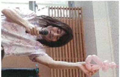
アシスタント やあちゃん(男?)